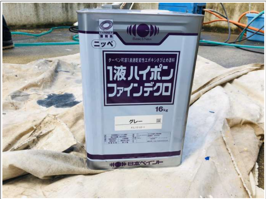
エポキシ錆止め塗料