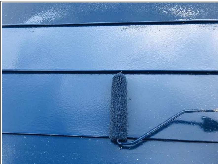
シリコン樹脂塗料 上塗り塗装