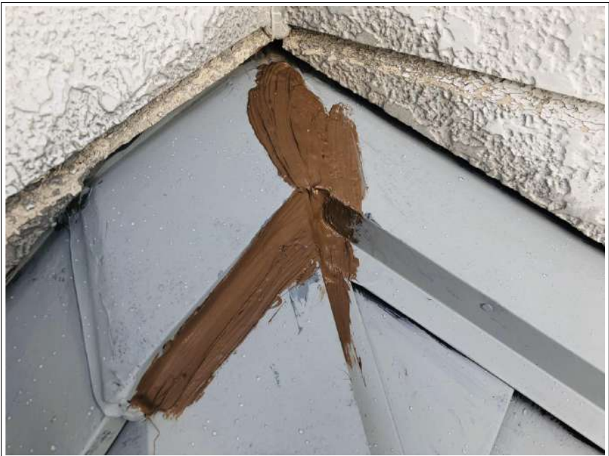
変性シリコン シーリング補修