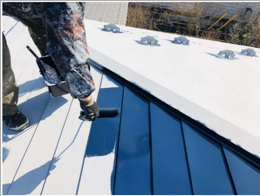
シリコン樹脂塗料 中塗り塗装