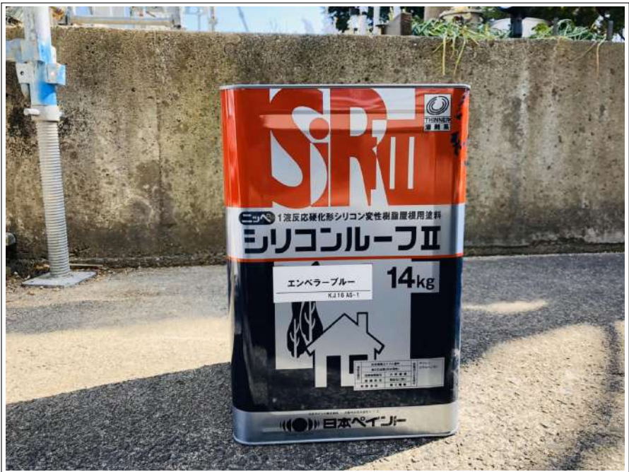
屋根用 シリコン樹脂塗料