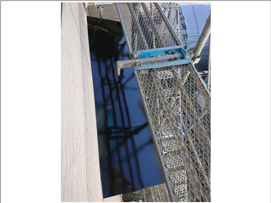
中塗り上塗り施工完了