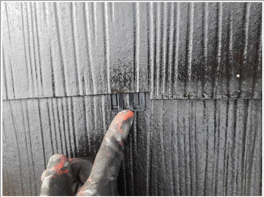
タスペーサー設置