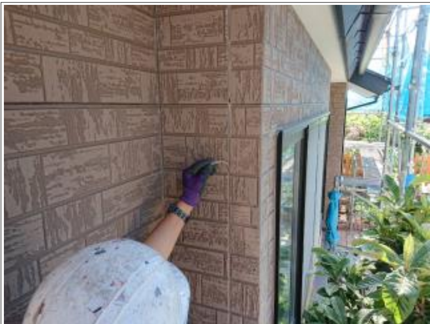
外壁シーリング打替え