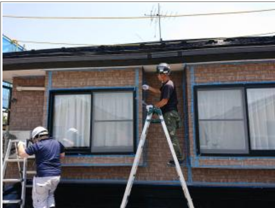
外壁シーリング打替え