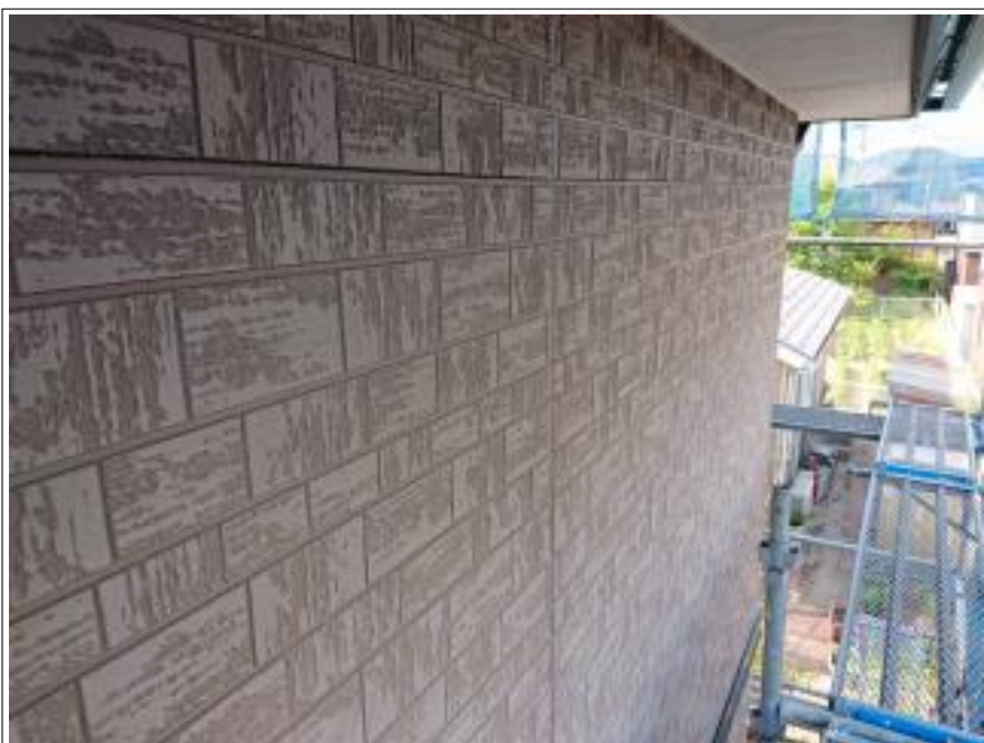
外壁シーリング打替え