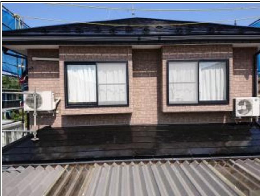
外壁シーリング打替え