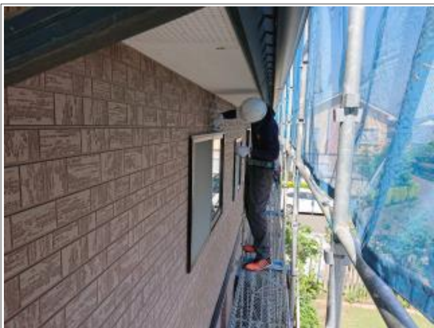
外壁シーリング打替え