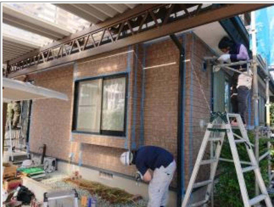
外壁シーリング打替え