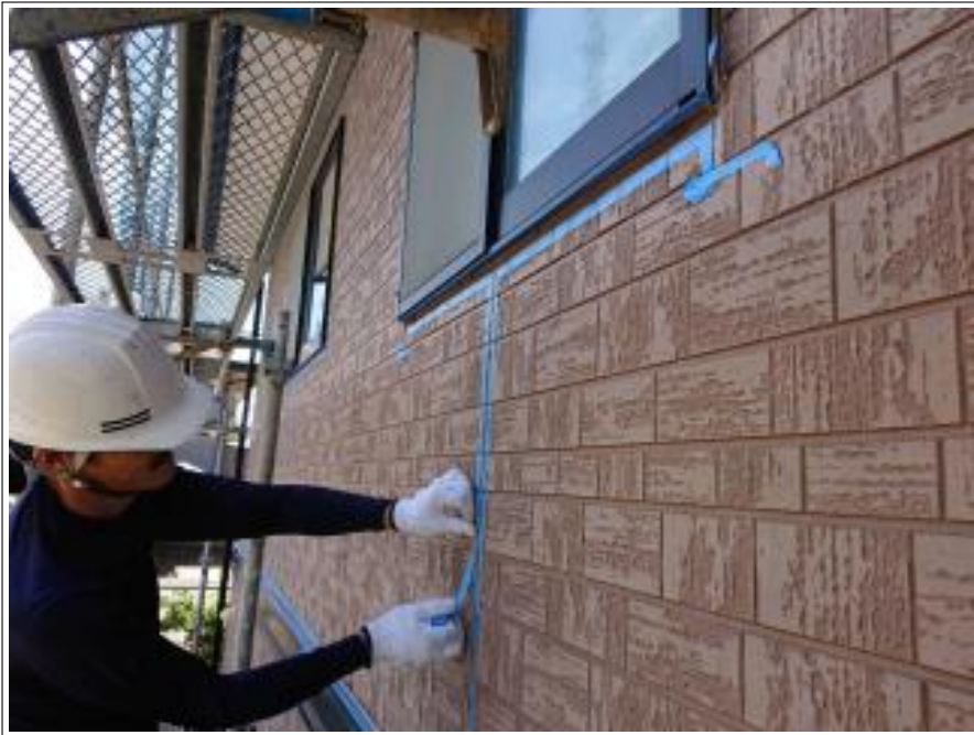
外壁シーリング打替え