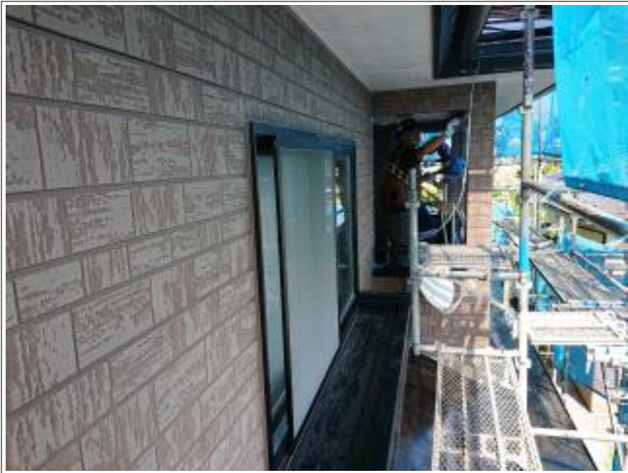
外壁シーリング打替え