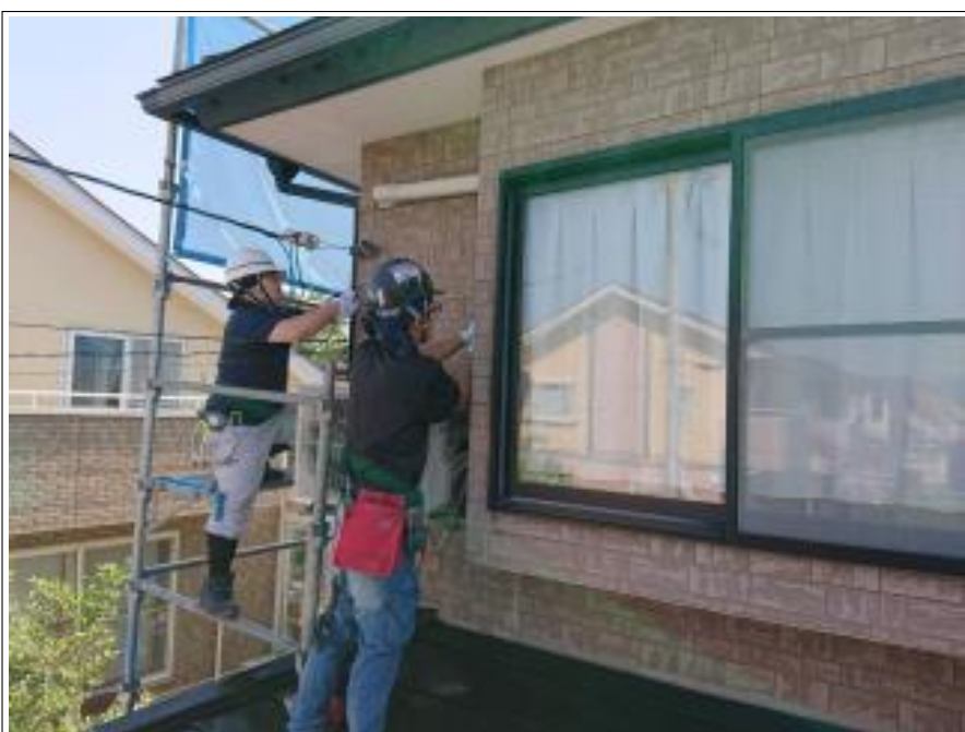
外壁シーリング打替え